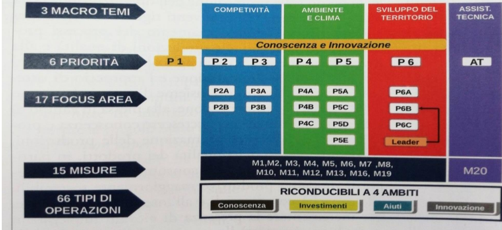
Fig. 2 - Schema generale della struttura del Psr 2014-2020 della Regione Emilia-Romagna

Fonte: Regione Emilia Romagna, «Supplemento n.59 – Luglio-Agosto 2015-Il Programma di Sviluppo rurale 2014-2020 della Regione Emilia Romagna»