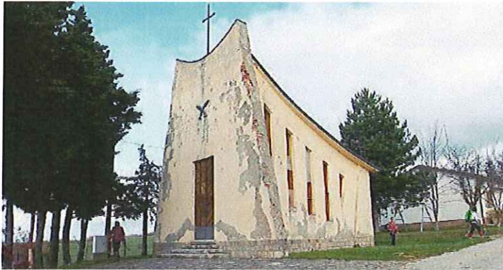
La chiesa-sacrario a Tavollicci